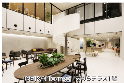
ISEIKAI lounge さくらテラス1階