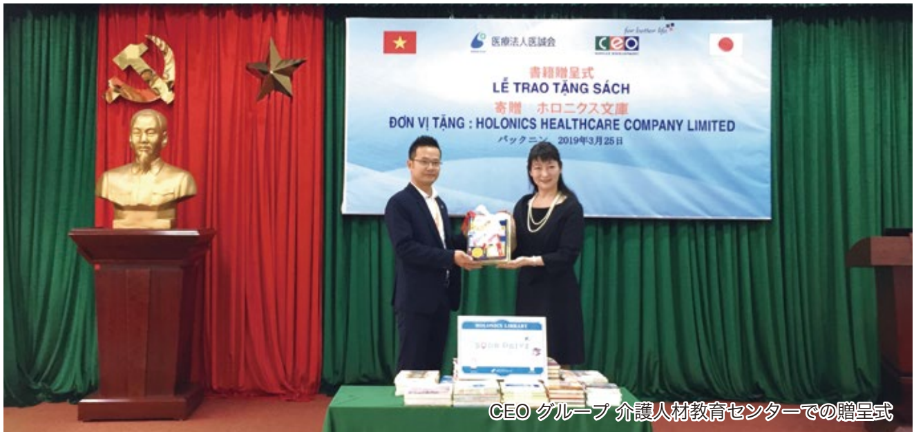
CEO グループ 介護人材教育センターでの贈呈式